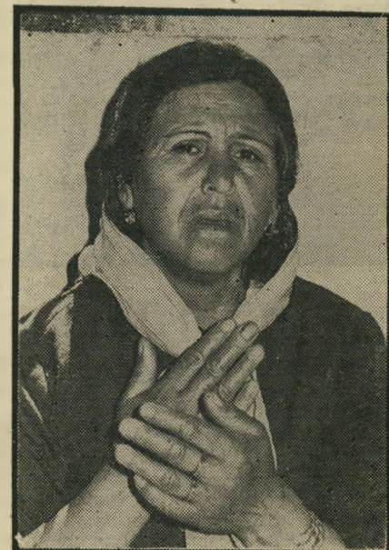
אם-ההרוג סומחיה שני בנים בשנתיים

קירות-האבן של הבתים, ושעריהברזל של כוחות-הביטחון, מונעים כל יציאה או כניסה לעיר העתיקה. בדרך זו מקווים כוחות-הביטחון להפריד בין שני חלקי העיר שכם, ולנתק מגע אפשרי בין תושביה.