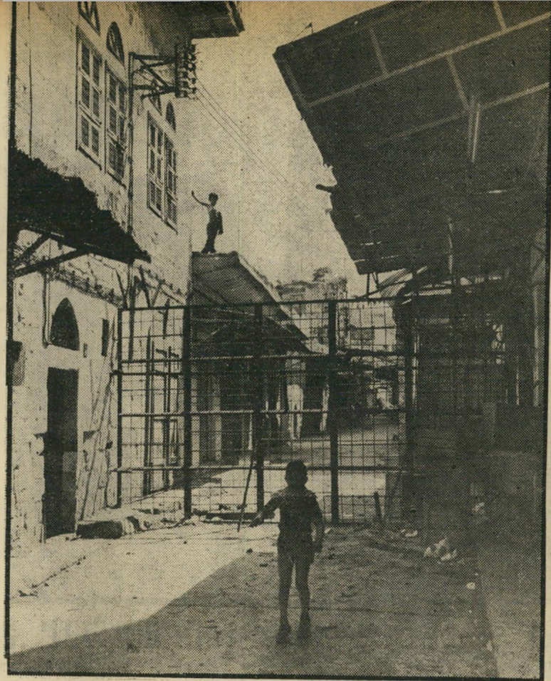
אחד משערי גטו שכם מקיים ביום, פורצים בלילה

הצעירים והילדים, הסגורים בתוך בתיהם בקאסבה, עולים לפעמים על גגות בתיהם, ומשם הם מנופפים בידיהם אל אחיהם בנייהמול שמאחרי השערים.