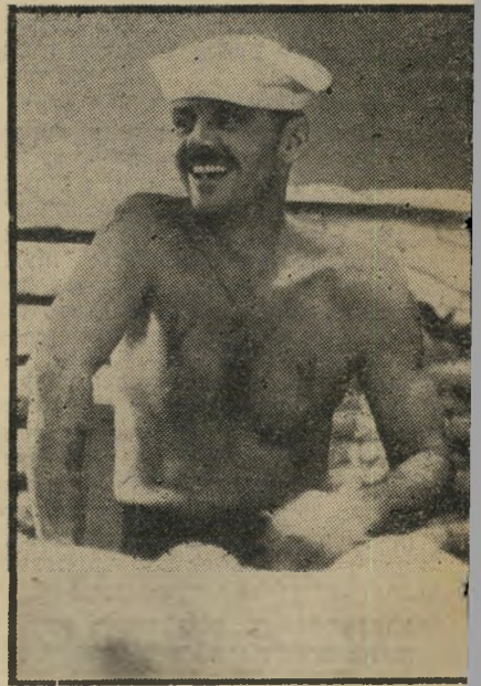
ניסיון ב': "הפרט האחרון" הסמל הקשוח

שיעבירו אותו מן הכלא למוסד סגור, ומביא איתו לבית-המשוגעים רוח-הזוית מרדנית שהפכה, בעיני דור שלם, סמל הנון-קונפורמיות הנחנק בתוך העולם הר-מטורף של היום. דימויו של ניקולסון, ככרגש מפוכח (חוץ מהתפרצויות בודדות) בעל שליטה עצמית מושלמת, לא הלמה ביותר את התפקיד, אולם המפיק מייקל דאגלס (בנו של קירק, שקיבל מאביו את זכויות ההסרטה) ושותפו, שאול זאנץ, סברו אחרת. ומסתבר שצדקו, אם-כי, לגבי ניקולסון, היה הסרט אחת החוויות המדכי-אות ביותר של השנים האחרונות.