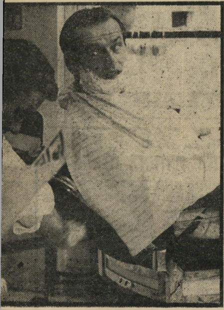
ניסיון ג': "ציינה-טאון" האינדיוידואליסט הקיצוני