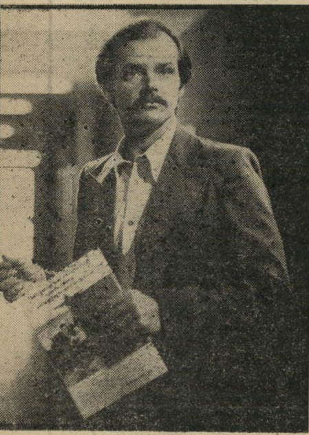
ניסיון ד': "זהות גנובה" החשכיל-העיתונאי