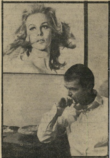
ניסיון א': "ידע הבשרים" הרוק התאותן

התאותן בידע הבשרים (שיש בהתנהגותן משהו מן היחס של ניקולסון עצמו לגשים); הסמל הקשוח בפרט האחרון; המשכיל המשנה זהות בזהות גנובה וכמובן, ההצי-לחה הגדולה מכל, זו של קן הקוקיה. התנ"ך של הביטניקים. סרט אחרון זה היה, מבחינה מסויימת, הפתעה לגבי ניקולסון. הוא קרא את סיפרו של קן קווי בשנות ה-60, כשהו היה מעין תנ"ך של דור הביטניקים, התפעל ממנו כמו כולם, אך עדיין לא העלה כלל בדעתו כי הוא-עצמו יגלם את מק'מרסי, הבריון האדמוני, המעמיד פני משוגע כדי