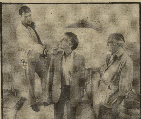
ריד, מאנאמקר, ווידמרק: סטנדרטי

מאומה בנדון, רק להזכיר שקיים אומנם עימות באזור, אבל אשמים בו בעצם רק פקדי-הביון של המעצמות, המשי-תמשים בו כבמגורש-מישחקים.