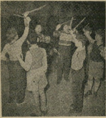
החזרות על תמונות הפוגרום

גולדה רוחצת באמבטיה ורודה וקוראת ספר. חושך. המקחלה שרה, "התקווה".