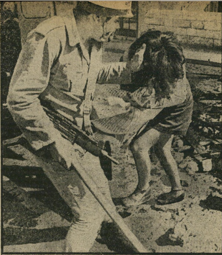
תמונת השוטר הישראלי המושך בשיעור הנערה הערבית ההפגנה פוררה

ומתהדת בין ישראל ודרום-אפריקה כי בחינת ברית של מנדוים, שבאין ברירה נאלצים להסתפק זה בידידותו של זה. שתיהן משתייכות למחנה המצורעים-הפריזיטיים הבינלאומי.