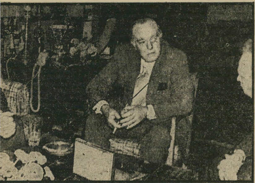
פורסטר בין רבין ופרם הבדידות קירבה

ספק אם היה בצעדו הקשוח של פורד כדי לועזע את אשיות המשק הישראלי. למרות האזהרות ההיסטריות שהשמעו מפי נגיד בנק-ישראל משה זנבר, למשק הפי ישראלי היה דרוש ועזוע הרבה יותר עמוק כדי לגרום לריפוייו בהלם. לשינוי מוסר העבודה ולמהפכה של אמת בתחום גבנית המיטים מבעלי-היכולת. קיצוץ של חצי מיליארד דולר אינו די