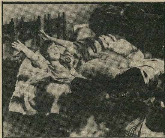
ג'יין בירקין — לקוח ללילה אחד