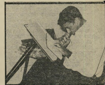
הלפרין דומד תורה הסיפוק הגדול ביותר

ניצב שם שולחן עמוס סיפרי תורה, גמרא וסדר, ושולחן נוסף שעליו מונחות בארי-סדר כרטיסיות החוסות כתבי-יד צפוף, ומחברות עבות.