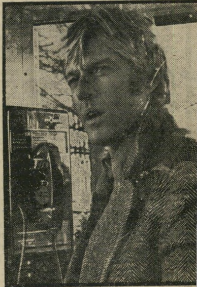
שחקן רוברט רדפורד לטהר את הפוליטיקה

עד כדי כך, שיש הסוברים בעולם ה-פוליטיקה האמריקאי כי בעיקבות ר.ר. הראשון (רוגלד רגן), שבא מן הקולנוע למירוץ אל הנשיאות, צפוי בעוד שנים אחר-דוה ר.ר. נוסף, רוברט רדפורד, אם כי בגוון שונה לגמרי מזה של רגן. רדפורד פעיל מזה זמן רב, בעיקר ב-נושאים האקולוגיים הקרובים לליבו, אולם הוא לא משך ידו כלל - למרות ועל אף