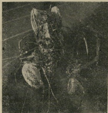
קיום יחדיו כטבע