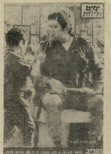
שער גליון „ימים וזיזות“ יום 26.3.76 הכותרת: קיום יחדיו בשכם

היום כבר לא זורקים אנשים, היום נחשפות שיניים צחורות בבת צחוק