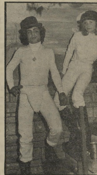
אנט שמן ויחי עמרני אתגר לפמיניסטית

מה שאני צריכה עכשיו, זה לנוח מפורים ולהשלים את שעות-השינה החסרות עוד לפני שמגיע פסח. כי למרות שהפורים האחרון נפל עלינו ביחד עם עליות ה- מחירים, היו בעיר הזאת כמה מסיבות שלא היו מביישות את הסילבסטר.