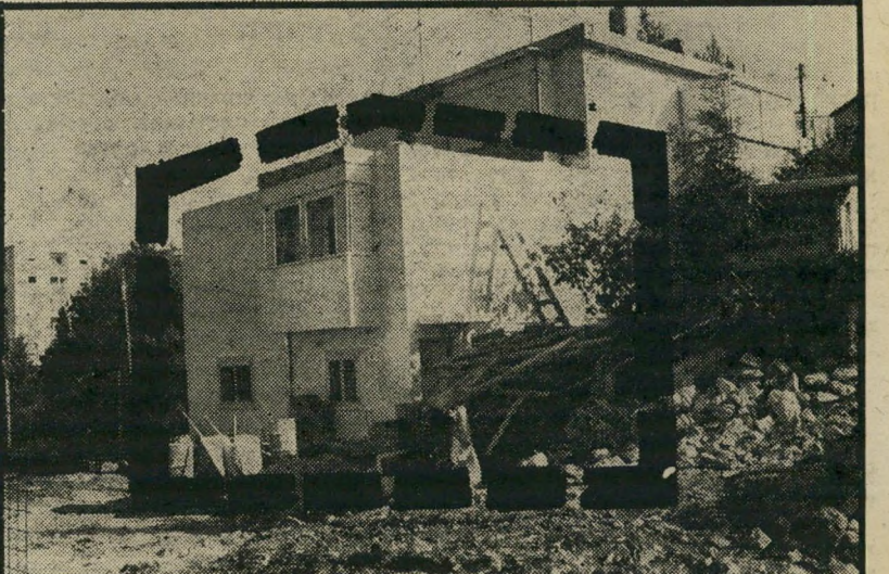
בית שומר-התנועה דוד מלול, ברחוב ציפורי מס' 4, שהוקם כתוספת לבית הקודם, ללא רישיון ועל אדמה שעדיין לא בוצעה בה פרצלציה (חלוקה). העבריין הורשע ונקנס, ועירעורו נידחה בבית-המישפט המחוזי, אך הוא לא נכחל, והמשיך לבנות עד שסיים את המיבנה.