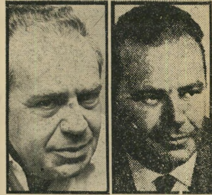
תמיר - במודעה וכחיים לואאנטיניזציה -

מדת זה, רבת הימרה ההיסטורית והפרי ליטית, מופיע מושג מישפטי אלמנטרי אחד ארבע פעמים, באנגלית לואאנטינית (Belligerency) במקום (Belligerency), ואין מגוון מן המסקנה שהמנהיג הדגול