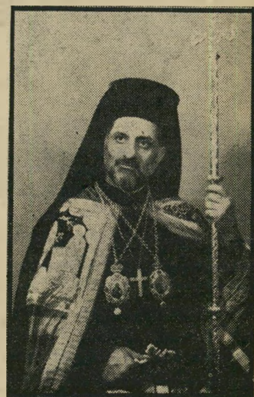
הארכיבישוף ריא לחם וצחוק בריא

פרשת בירעם-איקריה עלתה שוב לחדר שות. ראש-הממשלה הבטיח לדון בה מחדש. כאשר ייפתח הדיון, תרחף באלם דמיתו של האיש, שעשה יותר מכל אדם אחר לעורר את המצפון הישראלי לבעייה זו: הארכיבישוף יוסף ריא, הרי הארץ אם הבישוף לא נשכח בארץ, הרי הארץ