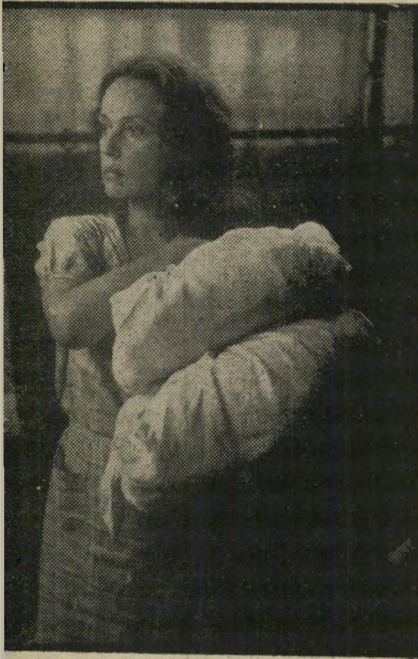
ז'אן מורו ב"זיכרונות מצרפת" כובסת כי תמלוק

סירטי-איכות חדשים. אולי זה מי שום שצרפת היא הארץ בעלת המסורת