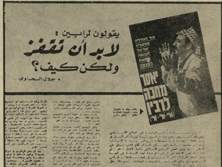
הכתבה עי "העולם הזה" איד יורדים מכאן?

זוכרים את ההלצה על היהודי שהת-קבל לעבודה בקירקס? השתמשנו בה לא פעם כדימוי למצבים פוליטיים שהתהוו במדינה. בפעם האחרונה היא הופיעה בהודון שכתב אורי אבנרי לפני כשלושה חודשים (העולם הזה 1996) שנושא את הכותרת לרדת! לרדת! שם התפרסמה הבדיחה בנוסח הבא: "יהודי מיוואש, הסובל מחרפת-רבע, מס' כים לקבל עבודה בקירקס. תפקידו הוא לקפון ממוטי מיגדל גבוה לתוך גיגית-מים קטנטנה. ההופעה מתחילה. חשיכה בקירקס. ה"מתופפים מכים בתופים שעה שהיהודי עולה, לאט-לאט אל ראש המיגדל, כשאלו מות הורקורים מלוות אותו. הוא ניצב על