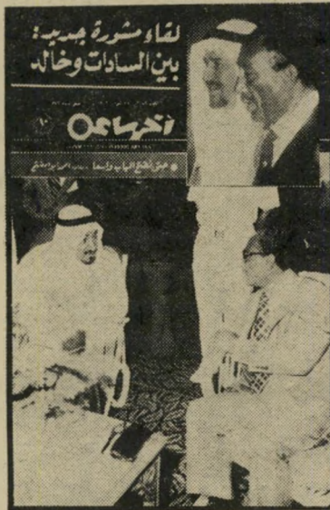
שער "אחר פאעה" איד יוצרים דימוי

מאמר מסוג זה, המתפרסם בעתון ערבי נפוץ, מציג את ישראל כמדינה שאינה