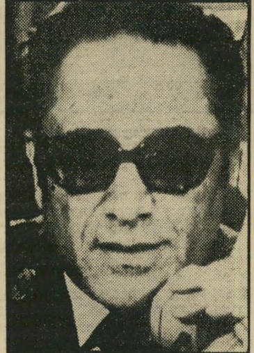
תת-אלוף אלאחדב לטובת ההסדר

מזה עשרות בשנים מאמינים הערבים כי "ישראלית הציונית זהתפשטותית" זור"ממת לכבוש את דרום-לבנון, כחלק מן המזימה ההיסטורית להקים את מלכות יש"ראל, מן הנילוס עד הפרת". פלישה ללבנון תאשר, בדיעבד, כי החשש הזה היה נכון.