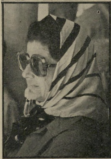
לאה רבין כל תמונה בוג

מזה זמן רב לא קראתי כתבה כה מרתקת וכה ציורית כמו הכתבה הגדולה על „מנהלת המדינה“ (העולם הזה 2006).