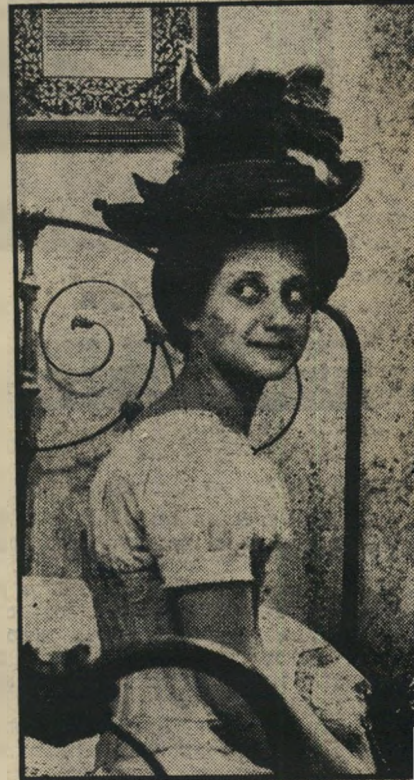
קיי ב,הסטר סטריט חום ובחוליות

*** בושם נשים (מוגרי, איטליה) — מסע של סרן עיוור מטורינו לנאפולי.