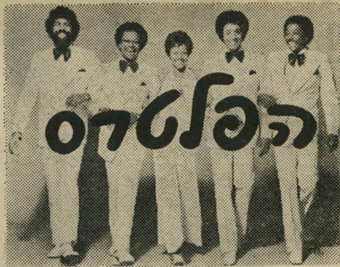
בשיתוף עם "להיטון"