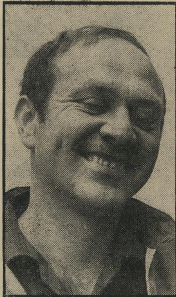
שליח אלוני מילחמה ממרחקים

אחרי שגלי צח"ל תחלו לשרד אחת ל-י שבוע תנחיתו לנהגים בעזרת מסוק, מבטיח ליבני כי מסוק ישרת את נהגי ישראל מדי בוקר, במיסגרת הבוקר הזה. כמו כן ישודרו ביומן זה ביקורות סיפרות ותיאטרון. רשת א' תחיה הרבה יותר כבדה ותמוסיקה היחידה שתושמע בה תחיה מר-סיקה קלאסית. תוכניות האומר הכבדות ימ-צאו את מקומן ברשת זו וכן יועברו אליה כל התוכניות לעולים, אשר עד כה שודרו ברשתות האחרות.