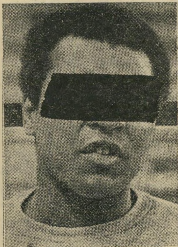
המחייג האט טילפן x ?

השיחה המפתורית — המשך או שמא כושי עד-באמת? האומנם נשיא מדינה אפריקאית? או שמא סוכן הסי-אי-אי? מי הם האפרוחים? מה הם שני הטון? מה פירוש „אקספרס ספיישל”?