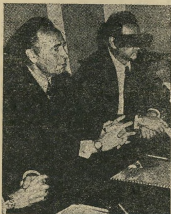
המחוייגים האט קיבלו Z ו- Y את השיחה?

האומנם סמים? או שמא חומר-נפץ? מי טומן חומר נפץ מתחת לכיסאו של מי? מי הוא יגאל? האומנם בנו של פייקוביץ? או שמא שר בישראל?