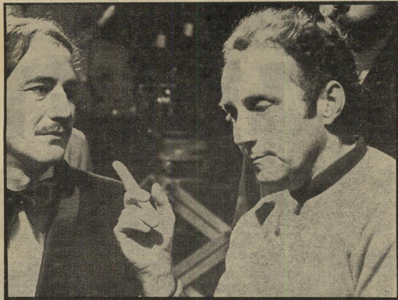
במאי אנדרה דלבו אהבה לאהבה ומוות

עם האוכל בא התיאבון. הסינמטקים בתל-אביב, חיפה וירושלים, אשר זכו בהצלחת-יוקרה ניכרת (ובהצלחה מיסודית בינונית), בשבועות שהוקדשו לקולנוע הפני, ההולנדי, המכסיקני ולסירטי הפורום הברלינאי, מתכוננים לקראת מביצע נוסף באותו סיגנון, שיהיה הפעם מוקדש לקולנוע הבלגי. המיבצע יהל בתל-אביב, ב-28.2, ובחיפה וירושלים ב-1.3 (ולא כפי שנכתב באחד מעיתוני-הערב, כאילו הוא נערך כבר בשבוע שעבר). הקולנוע הבלגי הוא אחד הפחות-מפוארים כיום באירופה, וניתן למצוא לכך סיבות רבות: פוליטיות, גיאוגרפיות ו-סוציאליות. בלגיה היא אחת הארצות הרבות ביותר, מבחינה כלכלית, במערב אירופה, חלק גדול מאוכלוסייתה דובר צרפתית וקרוב מאד לתרבות הצרפתית והיא סובלת, יחסית, ממעט זעזועים פוליטיים. אולם, למרות שאין לבלגיה, לכאורה, מגיעים רבים ליצירה מקורית, ניתן