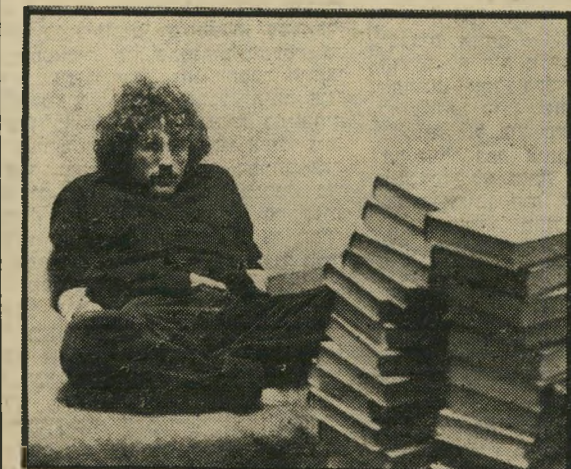
טימותי בוטומס: במטחנה האקדמית

פרופסור קינספילד, המייצג בסרט את מחנכי דור המישפטים החדש — שחצן, תוקפני ומזלזל — יורד לחיי תלמידיו, ומעורר את הערצתם ושינאתם גם יחד ביזע העצום שהוא מפגין, בנימה הלולגנית שבה הוא פונה אליו. הם, ועצם העובדה שהפרופסור מרצה על "חוזים", מאפ"ש שרת ליצור הקבלה מעניינת בין סיפרי החוקים והתק"דימים של חסטודנט בכיתה, לבין יחסיו עם בתו של הפרופסור, המתקשה לקבל את כניעתו מול שיטת-לוי-מודים הרומסת לחלוטין את אישיות הלומד. אבל בסופו של דבר, בריג'ס אינו מעזי ללכת עד הסוף.