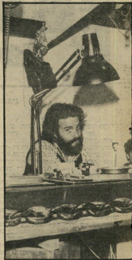
מפריי-תקליטים מגנט צדקה ומשקה יצילו מחוות

מודיעות לרא תשרום. הסיפרייה שוכנת בתוך חנות מיניאטורית בת שתי קומות. בקומה הראשונה ארבע מערכות