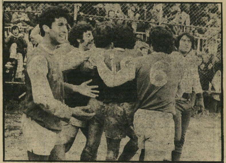
שחקני בית"ר ירושלים צוהלים בתום המישחק