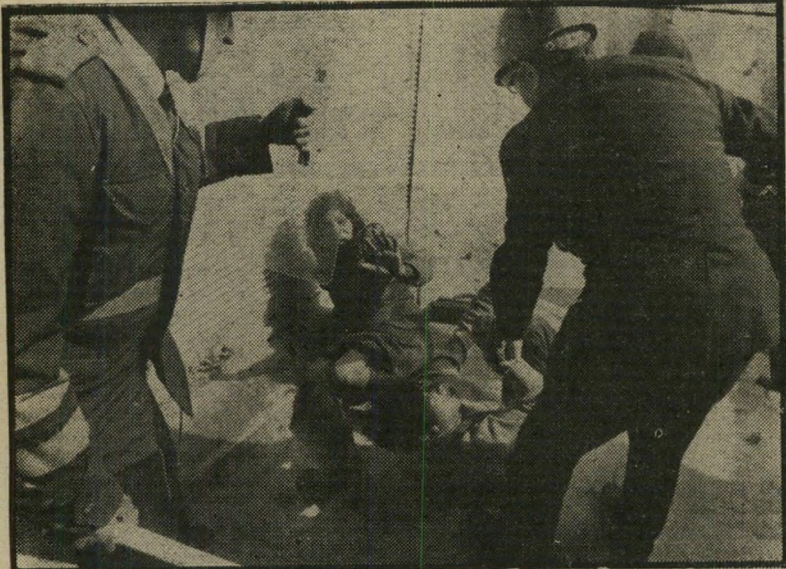
נער זנערה ערביים על הארץ בהפגנת ירושלים, דת במקום פוליטיקה

גם במערת המכפלה, שם ביקשו קנאי גושי-אמונים לגרום לתבערה דתית. נמוע עד כה עימות חמור. החודש החליט בית-הדין שישפוט כי מותר ליהודים להתפלל בהרם אל-שריף — האיזור המקודש של כיפת-הסלע ואל-אקצה. עד היום הזה נאסר הדבר על-ידי השלטונות הישראליים, בעזרת הרבנים שקבעו כי ממילא אסור ליהודים להתפלל שם, ביגלל איסורים הילכתיים הקשורים באי-הודאות לגבי מקומו המדויק של בית-המקדש. התנגדות חריפה. פסק-הדין החדש הפך את הקערה על פיה. במשך ימים