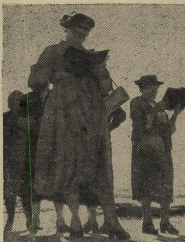
רוב הציבור בשעת תפילה לרמטכ"ל עם חזה שער