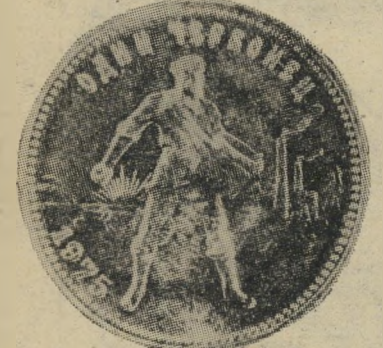
השכרונאט להיט סובייטי

ממשלת מערב-גרמניה קבעה השבוע, כי מדליות ומטבעות-זהב כפופות למס-הערך-המוסף, ככל שחורה אחרת. המס יחול לא רק על מדליות-זיכרון למיניהן, אלא גם על מטבעות-זהב, כמו 50 פזו מכסיקאי, ראנד דרום-אפריקאי הנושא דמות קרוגר, סוברן בריטי, וכן על ה-להיט האחרון בעולם - שרבוונאט, שהוא מטבע-זהב סובייטי של 10 רובל.