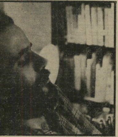
סופר עומר יש הימנון, יש סיביר

יאיר הלאומני התיישב וצחק עלינו. ישבו מופנמים בעצמנו כמו בבית קברות צבאי. בין קולות הלילה הזה לא נשמעו הדי ורעמי המהפכה, בכלובי-שיכור נים המתינו ההמונים במערומיהם לצווי מילחמתי חדש. כרסים שעירות נשפכות ללא תארייכווד, ללא סימניהיכר מעמי דיים. שלא תהינה לכם אשלויות. בבוקר תהיו חיילים בצבא הגדול הזה. אפסנאים יחלקו לכם נעליים ממוסמרות, חגורים, תמ"קים, ויעמידו אתכם בשורות ארוכות על צלע ההר. המהפכה שסיפרנו עליה נדחקה לשולי הדרך שבה פוטעים ליגיונות ההיסטוריה. המילחמה חזקה מהמפ"כה, כפי שתלושיה-משכורת חזקים מהי מהפכה. אבישוע פינקלשטיין הפוליטרוק ניסה