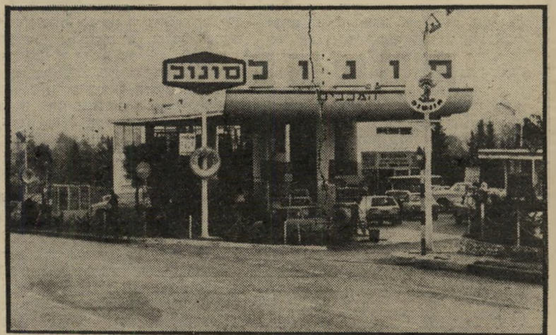
תחנת-הדלק של סביר תרומה בלתי-סבירה

לגבי התרומה בת 30,000 לירות, אישר המבקר כי הסכום נתרם על-ידי סונוול תמורת ויתור על שטח שבשליטת העירייה, למען הקמת תחנת-הדלק של סביר. המבקר, לא נאות להסביר כיצד מתיישבת עיסקת ויתור על קרקע עם תרומה-בכוח. לגבי 50,000 הלירות קבע המבקר כי לגביו קיים רק קריטריון אחד: אם הת'רומה הועברה לעירייה ולא לכיס פרטי של מישהו בעירייה, הרי מבחינתו המעשה כשר. אין זה מעניינו מדוע נתרם סכום גדול זה, מי האדם האמיתי ששילם את הסכום, ומה הדרכים שבהן נסחטה התרומה. שאלה אחת נותרה פתוחה: האם מבקר העירייה אינו מכיר את החוק, האם הוא אדם תמים, או שמא הוא מנסה לחפות על ראשי-העיריות?