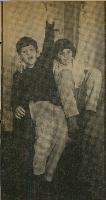
שיעור באות וי מוקדם מדי

מהצד השני, מוטלת על עיתונאי חובה עליונה שלא להסגיר את מקורותיו ולא למסור, בוודאי שלא לשליטונות, כל חומר העלול להפיל את אותם שמסרו לו מיד דע. בין מוסרייהמדיע, לצורך עריכת הית כתבה, היו כמה ספקייסמים וגם חיילים מעשנים רבים, אשר עם הסגרתם היו, ללאספק, מועמדים לדין.