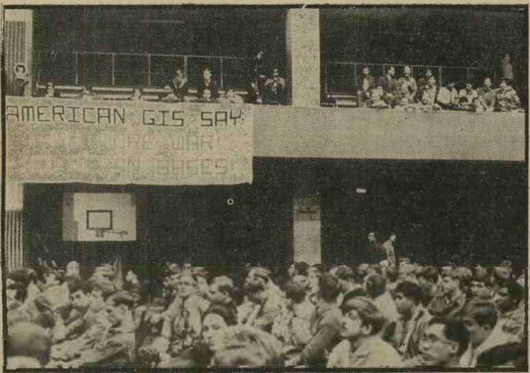
שלט כאסיפת מחאה ב"רפוק את הצבא" לא עוד מילחמה - לא עוד ביטיס באסיה!