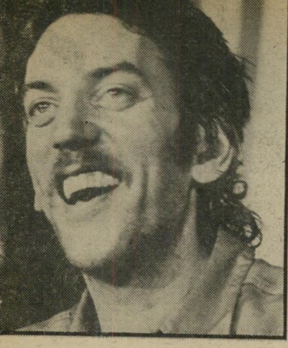
דונאלד סאתרלנד "אני אוהב את התחת שלי!"

1976 את הצבא הוא, מבחינות רבות, סרט מוחמק לגבי הקהל הישראלי. והר סיבה - גם אם משעמם לחזור ולשנן אותה בפעם המיידועי-כמה - היא שיטת הפצת הסרטים בארץ. זאת, משום שהסרט הצגת הבידור של ג'יין פונדה, דונאלד סאתרלנד וחבריהם ברחבי האוקיאנוס ה-שקט, לפני חמש שנים, הייתה מאד אקט טואלית או. היא תקפה בחריפות רבה את המימשל האמריקאי, וביתר ספציפיות את הנשיא ניקסון. היא נועדה להביע את סלידתו של חלק גדול מן העם ומן הצבא האמריקאי ממלחמת וייאטנאם, שאיש מהם לא חפץ בה ולא הבין מדוע היא מתחוללת; ובנוסף, באה לתקוע בעוד כמה חצוצרות מחאה שהיו אופייניות לת-קופה ההיא כמו שיחורור האשה בצבא.