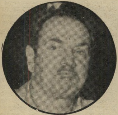
כוכב זיגל ראיון מטופש

הדברים המהותיים היחידים שאמר זיגל היו האשמות חריפות נגד מנהל המכס דויד פלד והבנקאי מייקל רובינזון , שהיוו חריצת מיספט בניגוד לכל כללי