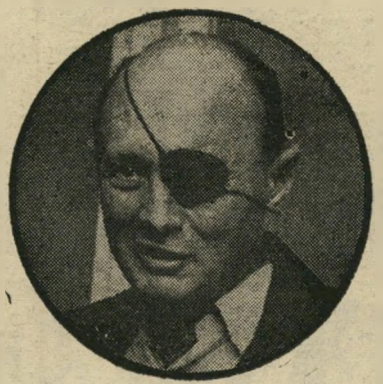
משה דיין מתוסכלים

ההתארגנות האמורה מתכוונת להציע את האנשים המתאימים, לדעת היוזמים, להחליף את המנהיגות הקיימת ולספק ל"מדינה, לפחות לתקופת-חירום לא ממושכת, מנהיגים מקצועיים. לאלה לא יהיה אומנם כל מצע פוליטי או כלכלי משותף, אבל לעומת זה הם יוצגו בפני הציבור כבעלי"כאריזמה, כבעלי-כוח אירגון וכמי ש" מסוגלים להתלכד, כדי לחלץ את המדינה והעם מההידרדרות לקראת שואה שהם מנבאים לה. מי עומד מאחורי ההתארגנות המוזרה,