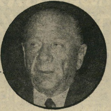
עובד בן-עמי בלי מצע

ואת שירותיהם של אילו מנהיגים היא עומדת להציע לעם?