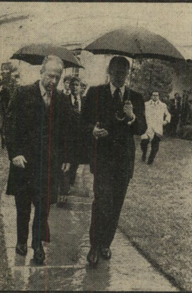
פורד ורבין על גלגלים

העיתונאים הרציניים במקום נדהמו לש-מע הדברים — לא רק בשל איחולתם, אל גם מפני שלא התאימו לסינונו של יצחק רבין, שהוא אדם אינטליגנטי. השבוע נפתרה החידה הסינונית. שוב ערכו העיתונאים סעודה. הפעם הופיעה