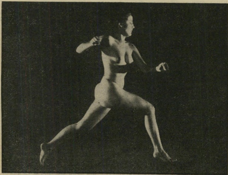
רוזבה ברמביזה ב"פינת הכתונות" הכנסייה והאיולת

המטרסם מתחילת המאה, שסקר את מהי פיכת מכסיקו בין השנים 15—1913, מאוחר יותר נסע לברית-המועצות, ושלח משם כתבות על המהפיכה הסובייטית, ייסד את המיסלגה הקומוניסטית האמריקאית, וכאשר מת ב-1923, נקבר בכיכר האדומה, כור היחידי שזכה בכבוד נדיר זה. הסרט נשאר צמוד לדייווחיו של ריד ממכסיקו, כאשר מצד אחד מצטיירת תמונה של הלך-רוחות מהפכני, מהומה וחוסר-סדר, ויכוחים פנימיים והשקפות-עולם שונות של מנהיגי המהפיכה; מאידך, תוך כדי הכרת המציאות סביבו, נוצרת והולכת התודעה המהפכנית של ריד עצמו. הסרט כולו צולם בכוונה תחילה בשחור-לבן כש'הבמאי, סול לדיקי, השתדל להקנות לצילוי מיו את הגוון של סרטי תחילת המאה, כאילו מדובר לא בשיתזור היסטורי של ימים אלה, אלא בשרידים תיעודיים מן הימים ההם.