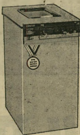
מכונת כביסה "לייד"

קריסטל מציגה היום 4 דגמים של מכונות כביסה: לייד, לורד, סופר לורד וגרנד לייד. שתי האחרונות הן גדולות יותר ובעלות קיבולת גבוהה יותר.