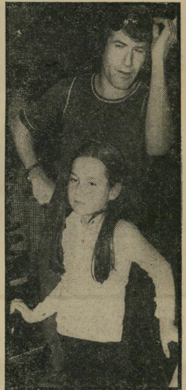
שדרן מנור אפילו לא לילדים

שוב משתמשת הטלוויזיה הישראלית בחומר הכי גרוע שיכולה להעמיד לרשותה הטלוויזיה הלימודית. תוכנית עלם ועלונה ששודרה ביום השלישי 13.1, הצליחה