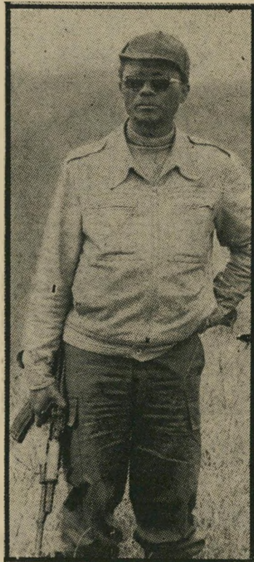
הולדן רוברטו תמיכה אמריקאית

שלוש תנועות-שיחרור נוטלות חלק במלחמת האזרחים המשתוללת באנגולה מאז קיבלה את עצמאותה אחרי 500 שנות כיבוש פורטוגלי. שלוש תנועות אלה לחמו נגד הכובשים הפורטוגלים ב-ניספר, על רקע מחלוקת אידיאולוגית ו-אישית ביניהן, המזכירה מעט את שלוש המחזרות העבריות שלחמו נגד שילטון המנדט הבריטי בארץ. הגדולה והמרכזית שבתנועות שיחרור אלו היא "התנועה העממית לשיחרור אנ-גולה" בראשותו של אגוסטינו נטו, הידועה בראשי התיבות של שמה מפר"א. במשך