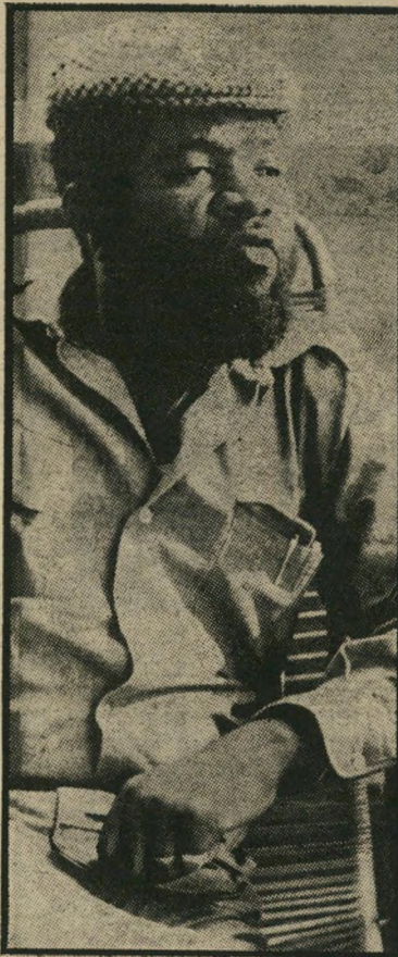
יונס מדיירו סאווימבי תמיכה דרום-אפריקאית

יהיה זה לפני מיספר שבועות, בעיקבות אחד ממסעותיו של שרי-החוף יגאל אלון בחו"ל. כותרת באחד מעתוני ישראל ביש-רה כי במסיגרת סיורו באירופה נפגש יגאל אלון בחשאי עם שרי-החוף של זאיר, עם ישראל. הדלפת הידיעה, שהוגדרה כ-סוד מדיני כמוס, עוררה את זעמו של