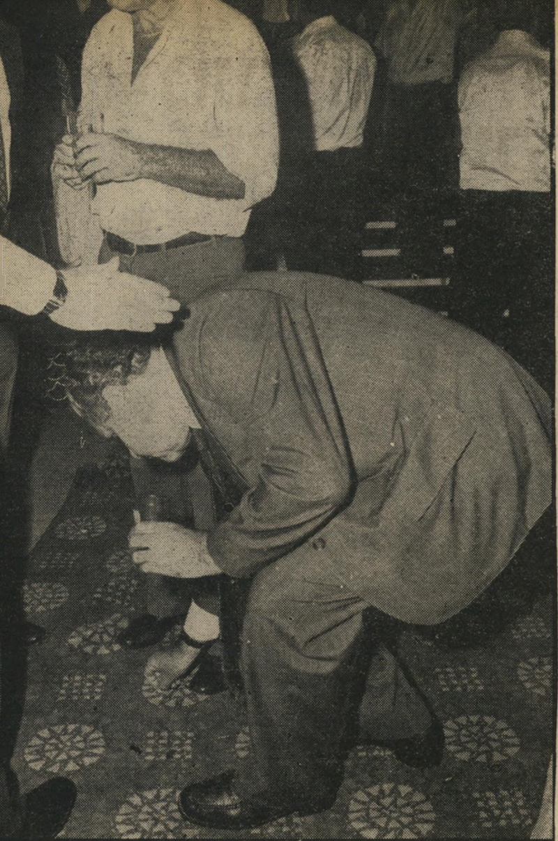
צדוק מתכופף ורבין מברך חזרה לימי דב יוסף

הצו מכונן ישירות נגד חופש-העיתונות. הוא מיועד להפוך את העיתונות שיערי לעזאזל לכל מחדלי המישטר. בנקודה זו יהיו שותפים לו גם מרבית חברי הכנסת, אין למעשה חוק תרעבה או תקנה המכוננים נגד העיתונות שלא ימצאו רוב אוטומטי בכנסת שיאשר אותם. כיוון שכמעט כל חברי הכנסת בלי יוצא מהכלל סובלים מביקורתה של העיתונות, הם מנצלים כל הזדמנות כדי לפרוע את החשבון. כבר היו דברים מעולם בישראל, די לזיכור מה שאירע בשנת 1965, כאשר חוק לשון-הרע המפורסם, שנחקק במיוחד נגד עורכי העולם הזה, הועבר בכנסת למרות הסערה הציבורית שעורר וגלי ההתקוממות נגדו. בדיעבד גרם חוק זה לבחירת עורך העולם הזה לכנסת ולביסוס מעמדו הציבורי של השבועון שלשם חיטולו הוא נחקק. הפעם מכונן הצו החדש נגד העיתונות