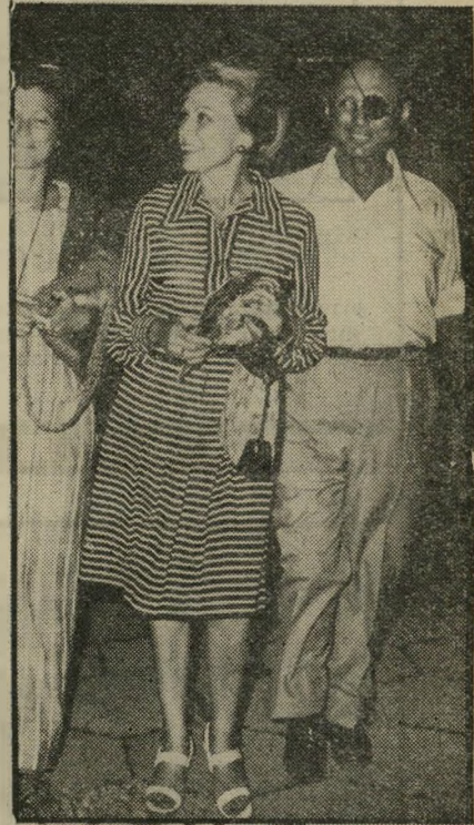
רחל ומשה דיין כישרון במפתיע

בעוד שרביהיטחון לשעבר, משה דיין, מפציץ אותנו בחדשות העיתון החדש שי הוא עומד להוציא. ועושה מזה רעש כאילו חסרים לו כלים להתבטא. הרי רעייתו רחל היא שותפה שקטה ועקרת בית למופת.