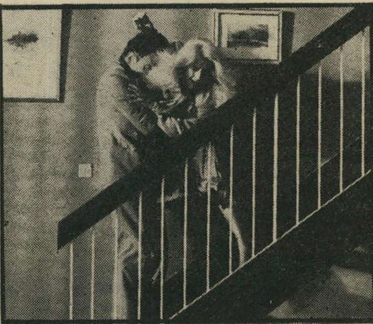
טרניניאן ודנב: קצת מכים

הצרה בכל הפרשה הזאת, הטובעת בדם ומהלומות, היא שכל מה שמסתתר מאחרי מעילי העור של אבירי ה-הונדה, הוא אישיות אנונימית חסרת ציביון כלשהו, ואילו כל מה שמסתתר מאחרי החליפות והעיבות, הוא מפלצתיות גרוטסקית חדי-צדדית, מעוררת בחילה. ואשר לבורגנות האחת