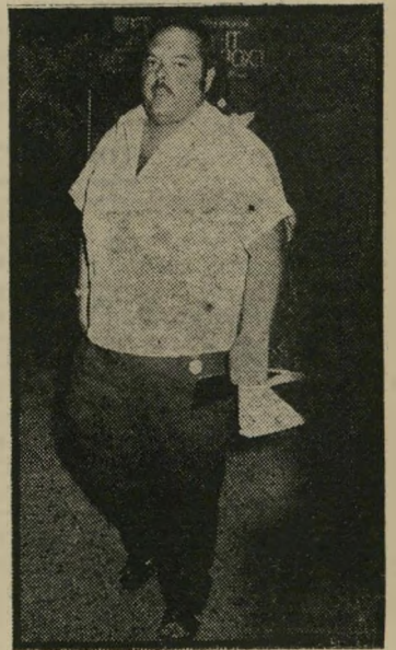
מפיק קול עיטקה טובה

אולם לא רק אולפני הסרטה הרצליה יוצאים נשכרים מכך שבדרום-אפריקה יש