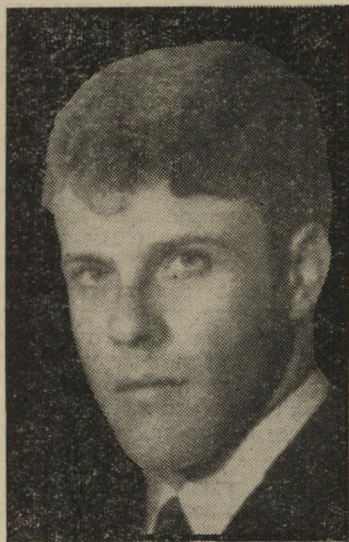
רוצח-מתאבד דעבול האם התאבד?