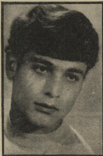
נרצח אולאי מדוע נרצח?

● ימניק ואשתו נפלו בידיהם של שור-דיים, לפני שהצליחו לבוא במגע עם