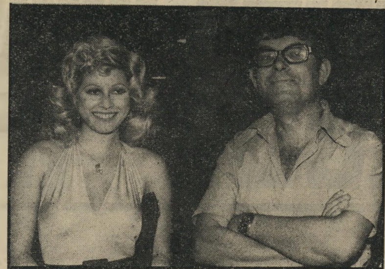
מנכ"ל ליבני * מנהל —