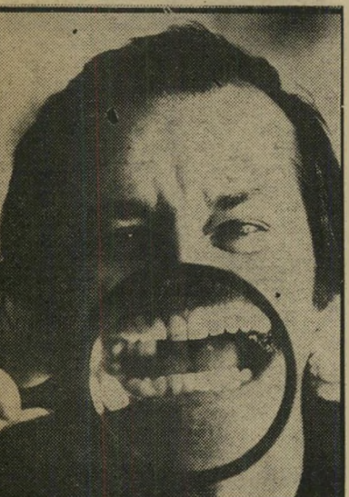
ניקולסון מחייך אחרי סמים ופטיכואנליזה —

ש לב חשני בטיפול במעשני סמים הוא הרפואי. איתור המעשנים, הי-ניסיון לגמלם מההתמכרות לסם והצעת שיטות רפואיות או פסיכולוגיות לחיילים כדי להיפטר ממכה חולה זו, דבוק למ"דיניות צה"ל שלא להכיר בחשיש כי-בעייה, היה אף חיל-הרפואה שאנו בעניין זה ורק לארנונה, בעיקר מאז מונה מ"אולו כמפקד החיל, ניכרת התעוררות מסויימת.