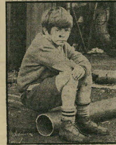
סטיבן ארצ'יבנר כ"ילדותי"

המיסעדות בישראל בתקופה האחרונה. לגבי סרגיו (הזרה) גובי, זהו סרט רגוע וחייכני במיוחד, אולם כותב-התסריט שלו, פול ג'אוף, ידע בעבר לחעמיק הרבה יותר בשביל במאי כמו קלוד שאברול, ולביבי אנדרסון היו ימים טובים וזוהרים יותר אצל אינגמר ברגמן. אולם חסידי הפוטוריזם, יקבלו תמורה מלאה.