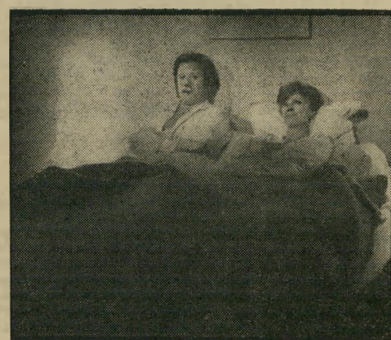
אנדרסון ופייר: תקלה מזורה

הבגידות שבנישואין (אורלי, תל-אביב, צרפת) — מוסר-ההשכל של סרט זה ישמח לב כל גבר. משום שהוא אומר בצורה מפורשת שנבר יכול לאהוב שתי נשים, והשד אינו נורא כל-כך. מה שמוביל למוסר-ההשכל זה, הוא מצחיקון בולווארי לא מזהיר במיוחד, על סוכן-תרופות מצליח, החי באושר ובעושר עם רעייתו בפרבר פריסאי-בורגני. ובאותה שעה עצמה הוא מאושר לא פחות עם זבנית בית-מרקחת בעלת נטיות אמנותיות, בסטודיו הפריסאי שלה. לכאורה, הסדר אידיאלי, עד שתקלה גורלית בטלפון (מן התקלות שה' קולנוע מיתמחה בהן ברינעי-מצוקה) הושף את האמת בפני הרעייה. היא נוקטת יוזמה, מתיידדת עם הפילגש, הופכת חברת-הבגוש, וכל זה מוביל, כמוגן, לרגע המכריע שבו הפילגש עומדת להציג בפני הסוכן המאושר את הטובה שבחברותיה וזו, כמוגן, אשת הסוכן. הגבר המעוצבן טורק את הדלת, עוזב בזעם את הדירה וצועק עליהן: „בגדתן בי, ואני האמנתי בכך!" אבל אל דאגה — הסוף טוב. אם הבדיחות שבסרט אינן תמיד מן השנונות ביותר, והקומדיה אינה חודרת באמת תחת עורם של הגיבורים (אבל מתעכבת מזמן לזמן על דימועות הגיבורות), יש גם לפחות דבר מרגיז אחד: האירויות הדשנות והרבות, עם סרטינים ברוטב, יינות משובחים ושאר המעדנים הלא-כשרים המטריפים דעתו של אדם, בעיקר נוכח מחירו