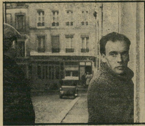
ז'אן-לואי טרינטיניאן: הזדהות מזורה

סיפורו של שוטר (אסרה, תל-אביב, צרפת) — לימאורה, עוד פישעון על הבלש האנושי והרוצח הסאדיסטי, שמסתיים כמוגן עם לכידת הפושע והענשתו כיאות. הפעם, זה מבוסס אפילו על סיפור אמיתי, חלק מספר-זכרונותיו של מפקח המישטרה הצרפתי בורניש, הדואג כמוגן לתאר עצמו באור סימפטי ואוהד. אלא שסרטים כאלה טומנים בחובם לא מעט סכנה, כאשר הם מנסים להתחכם ולדבר לא רק על עלילה בלשית, אלא גם על אמת אנושית כלשהי, המסתתרת מאחריה. וזה מה שקורה כאן, כשנרמז שהמישטרה ושיטותיה ה' אלימות (שרק הגיבור עצמו, הבלש בורניש, מסתייג מהן) אינה עדיפה על העולם-התחתון וחיסולי-החשובות שלו. הרעיון כשלעצמו מתקבל אולי על הדעה, אלא ששום דבר, בסרט עצמו, אינו מביא לו סימוכין. אלו דילון מגלם מפקח-מישטרה נאה-לעין ובעל אישיות מקסימה, אבל הוא פחות ממשכנע מבחינה מיקצועית; הוא מתנצל לפני פושע בטרם ידרוש ממנו לבגוד ברעיו, וסובל בשל כך ייסורי-מצפון קשים. מצד שני, ז'אן-לואי טרינטיניאן בונה דמות של רוצח סאדיסטי, כימעט-מטורף, איש שאין בו שמץ של אנושיות והסיבה היחידה להתנהגותו היא ילדות קשה (דוקטור פרויד המסכן בלבלב את כל העולם), אם כן, מניין באה הזדהות המזורה שחש המפקח, בסוף הסרט, עם טורפו, אם לא מהעמדת-פנים ומקנה בצורה זו, לפשע, תכונות נעלות שהן ממנו והלאה?