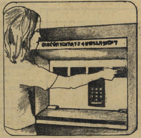
4 משוך את כרטיס הדיסקונטומט.