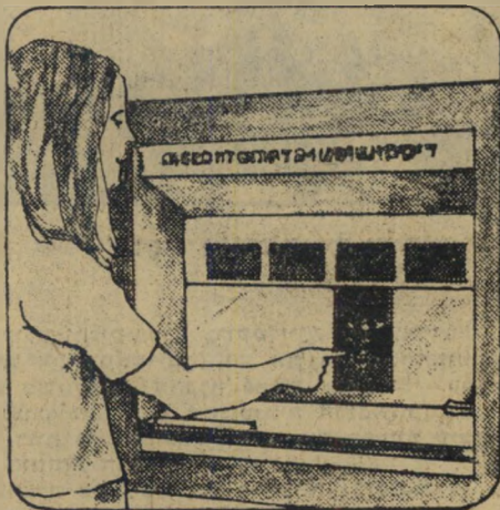
3 הקש את מספר המיכלים הדרוש לך.

לפנות בוקר. בצהרי היום או בחצות הלילה. 24 שעות ביממה תוכל למשוך כסף במזומן. עד 300 ל"י. ללא תור. ללא הצגת תעודות או משיכת שיק. אם אתה לקוח של בנק דיסקונט או בנק ברקלים דיסקונט ובידך כרטיס הדיסקונטומט - תוכל למשוך כסף במזומן בכל עת.