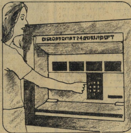
2 הקש את מספרך הסודי. אם פעית. הקש "R" ונסה שנית.