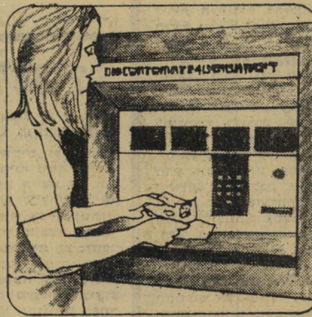
5 הוצא את הכסף מהמיכלים.