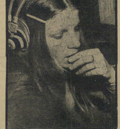
קריינית דורן ניתוח בגרון

שרה לקתה בצרידות, אשר אינה מניחה לה כבר שבועות רבים, בבדיקה רפואית