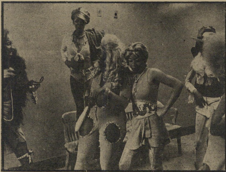
בית-הבושת של קסאוויריה חולנדר ב"היצאנית העליונה" המיסוד יגרום לשלוש מערכות של סרטורים..."