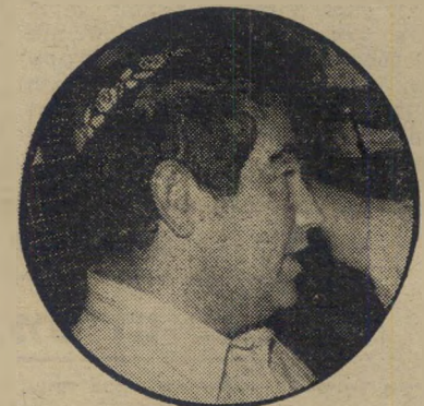
השר המר נגד