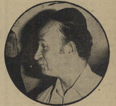
השר שם-טוב בעד

בעיתיהן. ביחידתה המטפלת בנערות ב" מצוקה וגם בנערות העוסקות בזנות וה" מבקשות לשוב למוטב, שתי עובדות סוציא"ליות ופסיכולוג בעל תואר ב"א בפסיכולר"גיה.